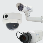
Illustra IP 摄像机